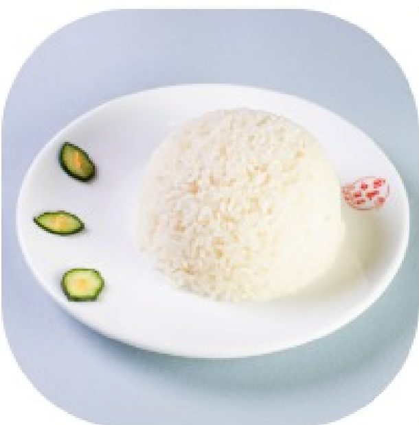
Рис на пару